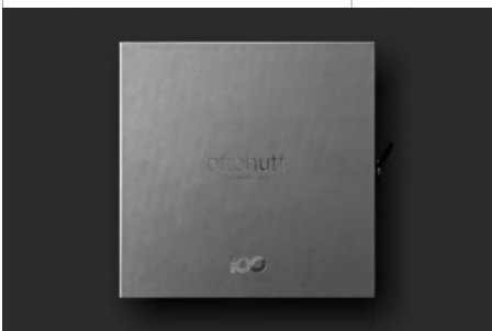
Packaging 100YRS Edition.